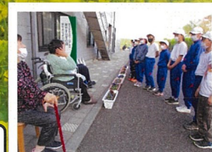
寺尾小学校栽培委員会より『パンジーの花』を寄贈いただきました