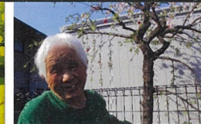
春の花と笑顔が咲きました