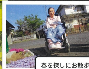
春を探しにお散歩へ