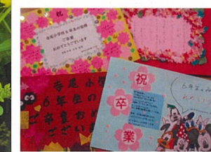
寺尾小学校と寺尾保育園へ卒業 卒園お祝いメッセージを送りました