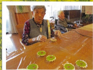
たんぼぼを片手にウインクしてチーズ